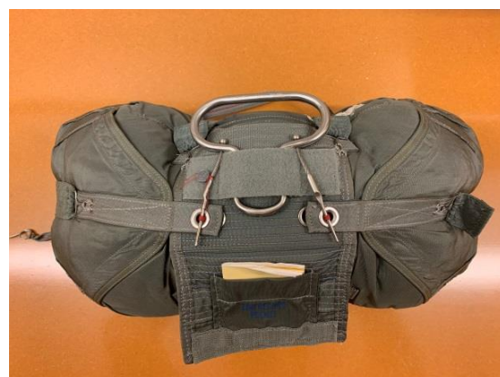
SLCP openingsysteem soft loops zichtbaar