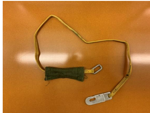
5 ft. Extensie (oud model)