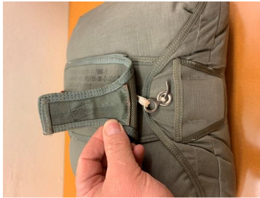
T11-R openingsysteem curved pin softloop/Runningloop