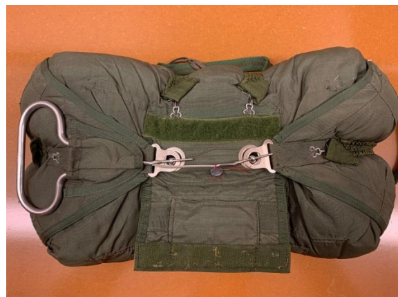
T10-R Openingsysteem Hard cones zichtbaar