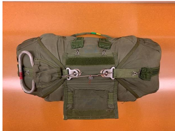
MIRPS Openingsysteem Hard cones zichtbaar