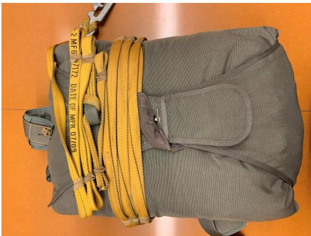
MC6 openingsysteem softloop curved pin